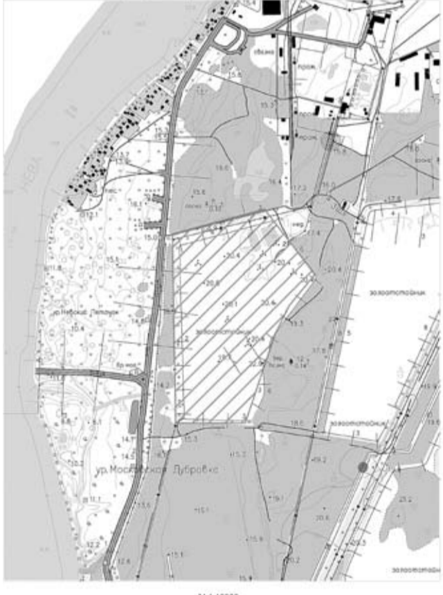
Схема территории, закрепленной с целью благоустройства