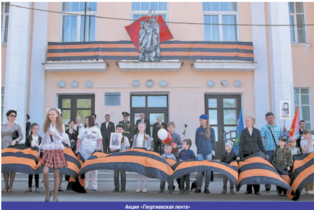
Акция «Георгиевская лента»