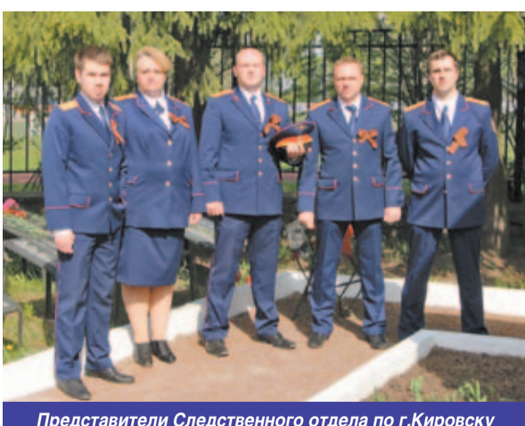
Представители Следственного отдела по г.Кировску