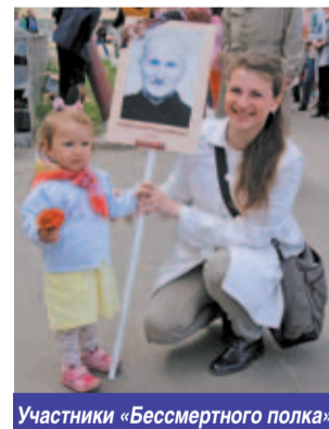
Участники «Бессмертного полка»