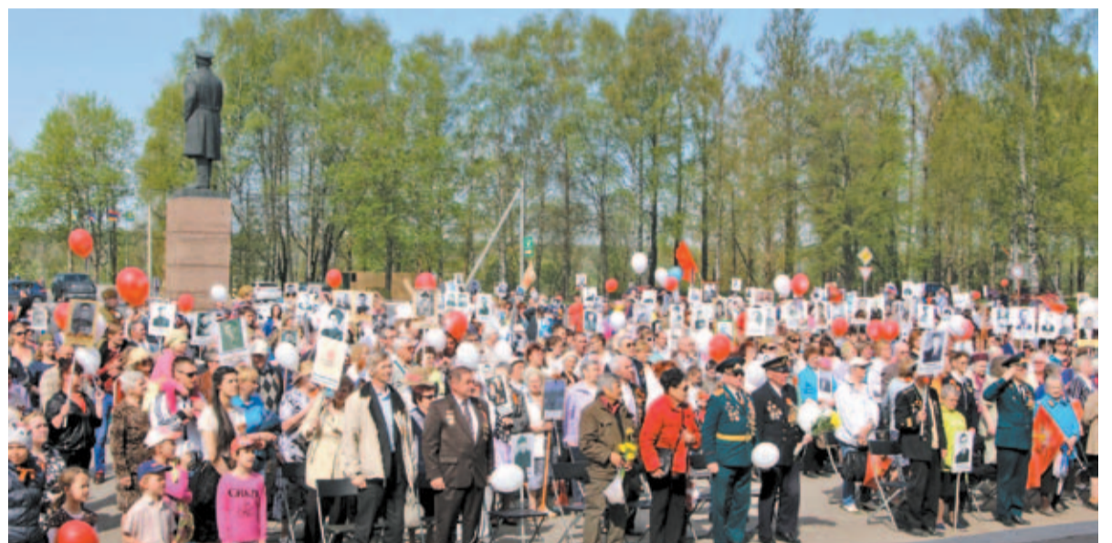
Митинг на Театральной площади