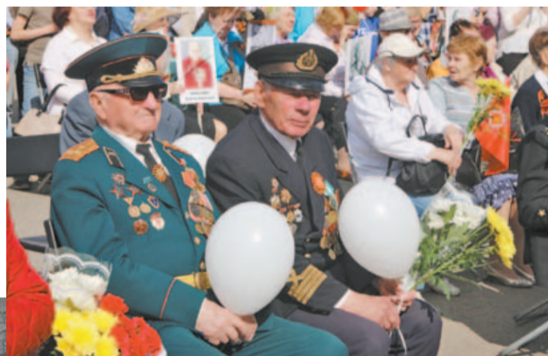
Участники Великой Отечественной войны