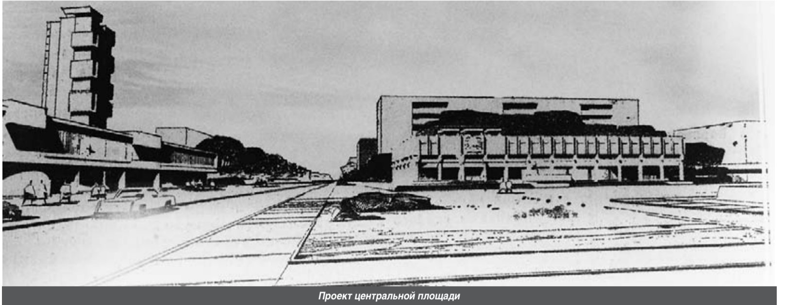
Проект центральной площади

В июне 2016 года наш город отметит свой 85-летний юбилей. К празднику газета «Неделя нашего города» подготовила рубрику «Кировск-85», в рамках которой на страницах нашего издания мы расскажем об интересных фактах из истории города. Сегодня мы ознакомим вас с генеральным планом развития города.