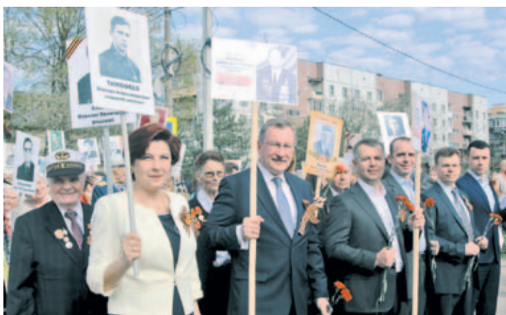
Шествие «Бессмертного полка»