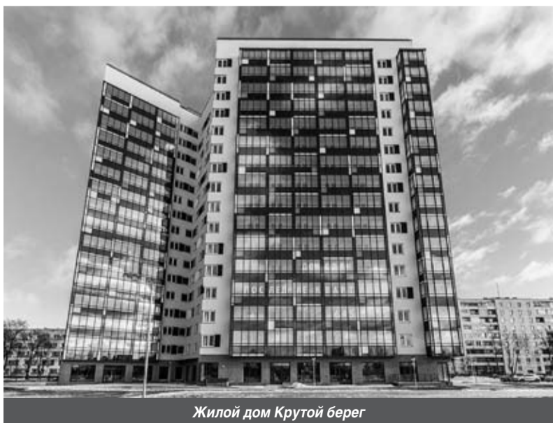
Жилой дом Крутой берег

она. Здесь 22 февраля 1985 года в красивом сосновом массиве состоялась закладка больничного комплекса на 240 коек с консультационными и вспомогательными службами (комплекс остается в «замороженном» состоянии до сих пор). Авторам этот микрорайон представлялся в виде амфи-