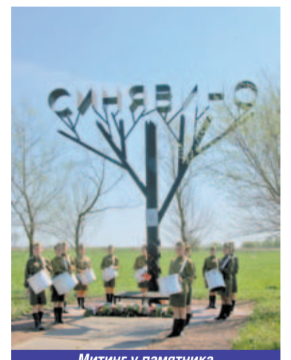
Митинг у памятника «Сожженная деревня Синявино»