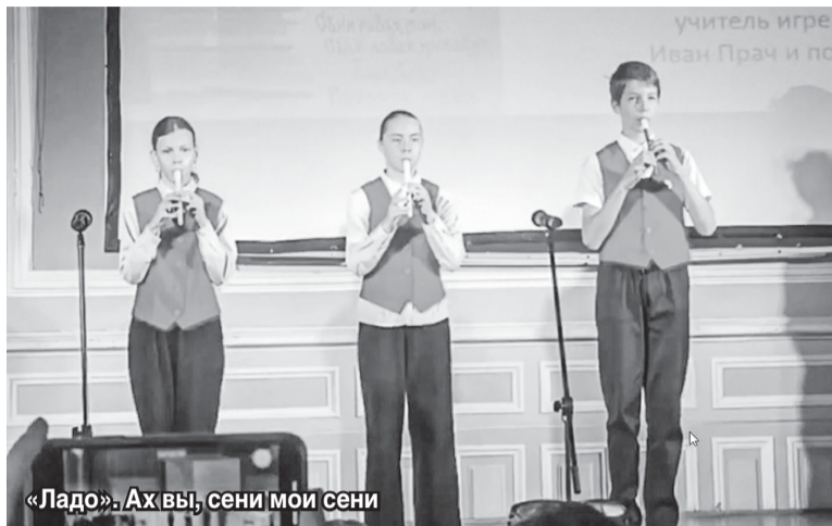
«Ладо»: Ах вы, сени мои сени

Недавно «Ладо» и «Ладики» успешно поучаствовали в XII Всероссийском конкурсе-фестивале «Свирель — инструмент мира, здоровья и радости». Он проходит в Президентском физико-математическом лицее №239. На открытии конкурсантов всегда